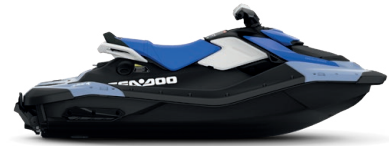
● Dazzling Blue / Vapor Blue